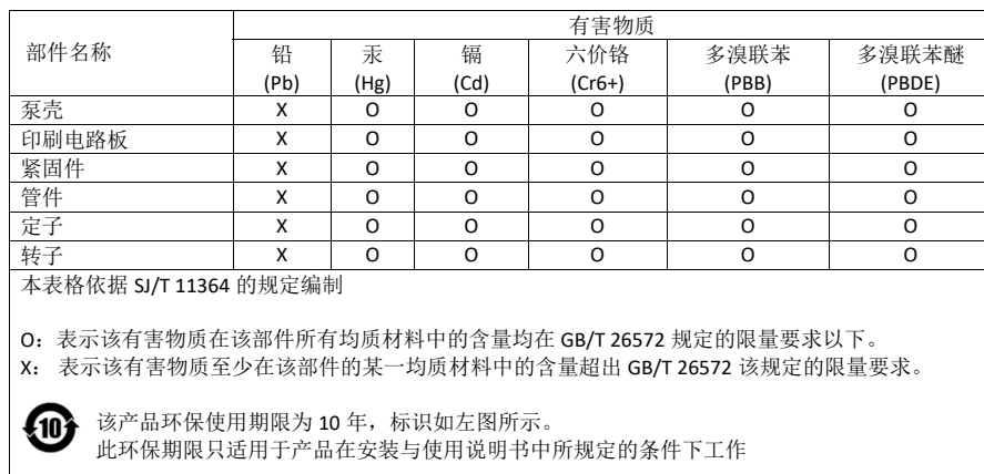
产品中有害物质的名称及含量