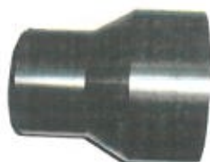
Reducție din PEHD

Fitingurile injectate sunt utilizate în instalații cu presiuni de max. 40 bar (funcție de SDR și materia primă utilizată la fabricare).