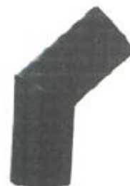
Cot din segmente sudate din PEHD

de maxim 100% din valoarea presiunii de utilizare a țevilor din care au fost realizate (valoarea presiunii variază în funcție de tipul fittingului realizat, de domeniu de utilizare, de materie primă și de SDR).